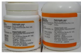
Foto 2. El nombre del fabricante original es Ciron Drug & Pharmaceuticals Pvt. Ltd. y el falso Ciron Drugs (Pharmaceuticals) Pvt.Ltd.