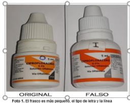
Foto 1. El frasco es más pequeño, el tipo de letra y la línea amarilla es más tenue en el envase original.