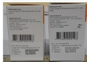
Foto 3. Las cajas presentan diferentes números de lote el Original indica lote ZED05299, el falso lote OEB13359, el mismo que no corresponde al titular del registro sanitario. La fecha de vencimiento del lote ZED05299 original es 07/2022.