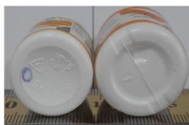
Foto 5. El sello del frasco original presenta grabada información en alto relieve y el falsificado no presenta.