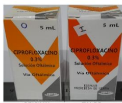
Foto 4. El tipo de letra, la impresión de la caja presenta color blanco con líneas amarillas oscuras y anchuras que difieren del original.